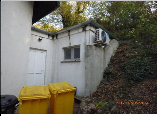
a dombra épített felépítményrész

8636 Balatonszemes, Kisfaludy utca 1231/13 hrsz.