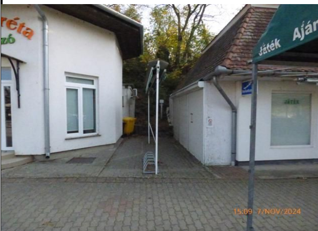
a telek+ hátsó részének megközelítése