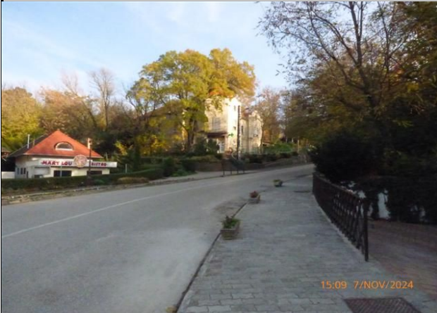
utcakép Szabadság utca

8636 Balatonszemes, Kisfaludy utca 1231/13 hrsz.