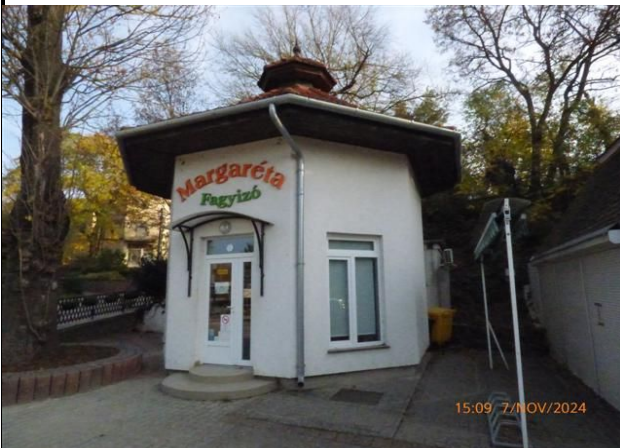
a saroktelek a Kisfaludy utca felől+homlokzat