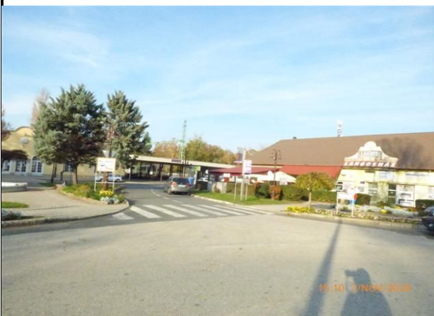
az ingatlan környezete