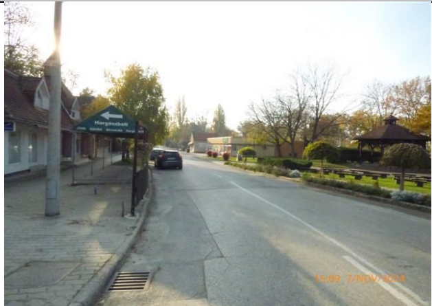
utcakép Kisfaludy utca