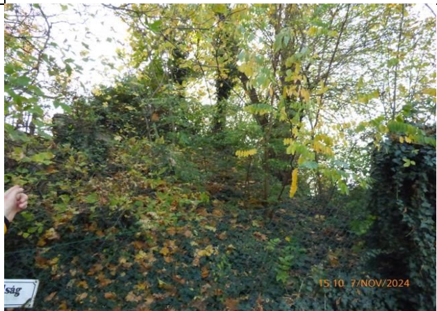
a telek a Szabadság utca felől