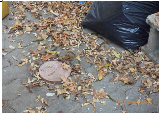
szv tisztító idom