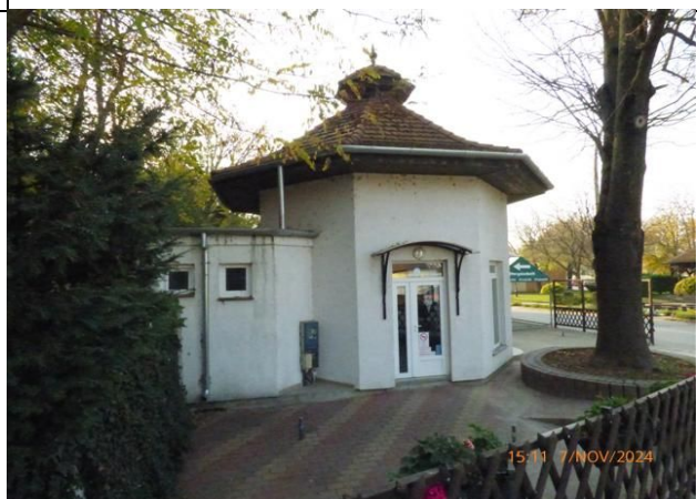
a telekes felépítmény a Szabadság utca felől