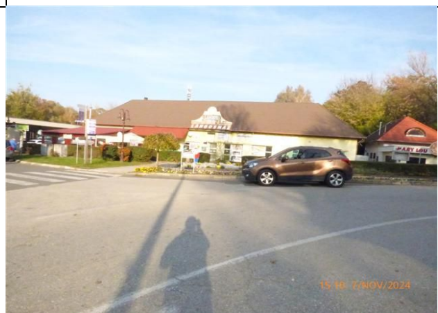
az ingatlan környezete