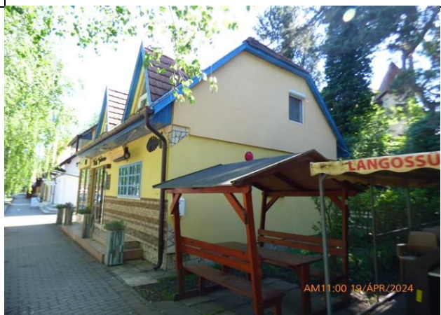
a telek és a rajta álló felépítmény