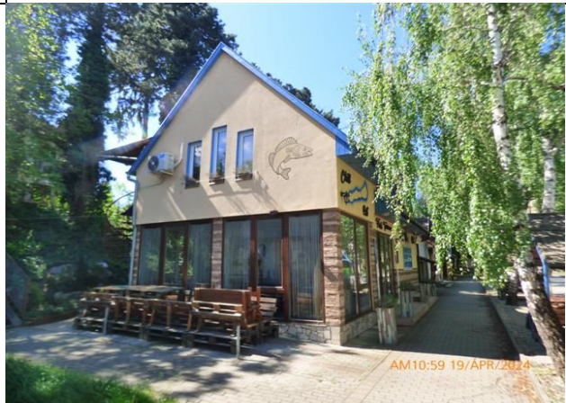
a telek és a rajta álló felépítmény