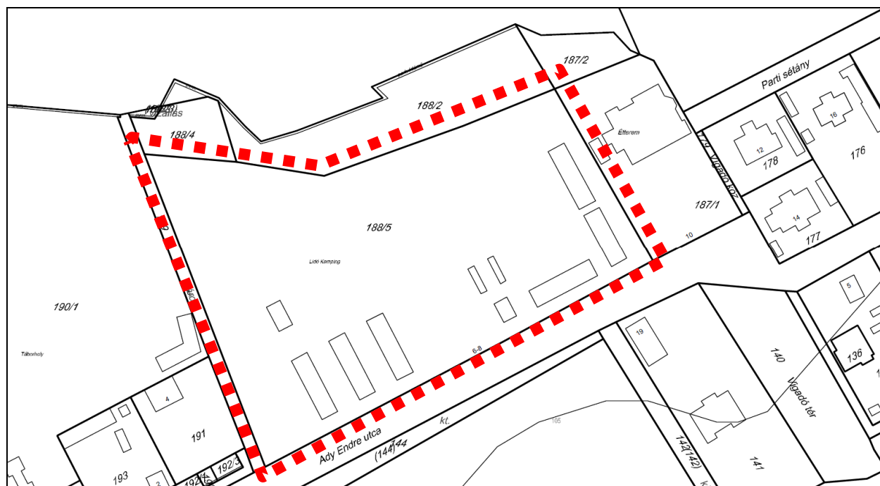
Földhivatali alaptérkép a módosítással érintett terület határával

Jelen tervdokumentáció az egyszerűsített eljáráshoz elkészített Véleményezési Tervdokumentáció.