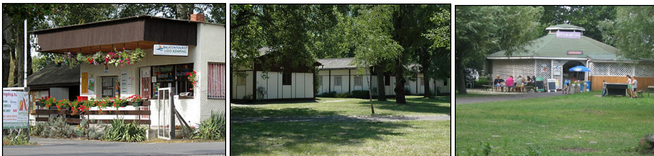
A Lidó kemping területén található épületek

A kempingben meglévő épületek (faházak, recepció, büfé stb.) földszintes kialakításúak, a kemping környezetében sem található ennél magasabb beépítés.